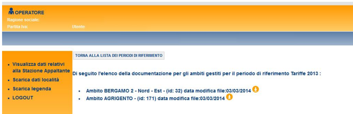
Figura 1.4: Download

Una volta effettuato l'accesso, è possibile procedere alla visualizzazione dei dati inseriti in fase di accreditamento e al download dei dati per gli ambiti gestiti.